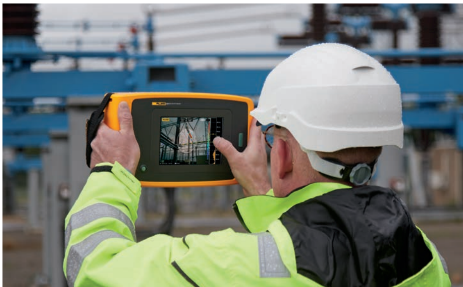
Снимок сделан прецизионным акустическим устройством визуализации ii910 при обнаружении частичных разрядов на высоковольтном оборудовании.